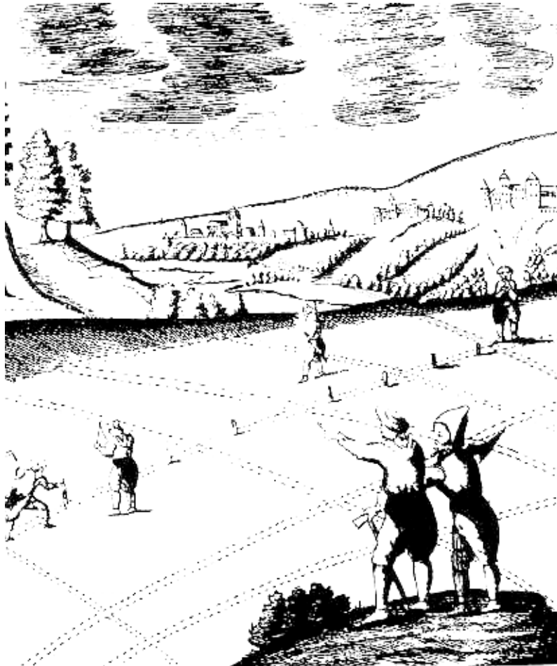
Bild zeigt Rutengänger im Altertum um 1700 n.Cr